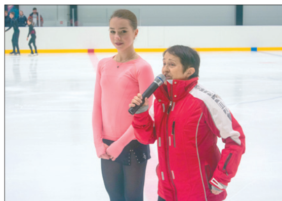
Выдающийся тренер Тамара Николаевна Москвина воодушевила всех своим оптимизмом.