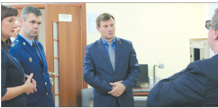
У клиентов центра появилась возможность узнать ответы на свои вопросы из первых рук – от руководства района.