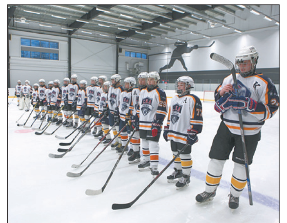
На льду – будущие чемпионы мира.