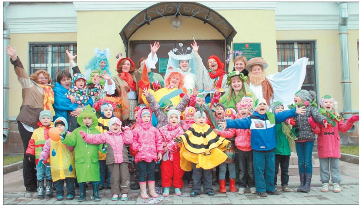
Желаем коллективу и воспитанникам детского сада № 25 только счастливых дней!

ДЕТСКИЙ САД № 25 ОТМЕЧАЕТ 80-ЛЕТИЕ. МЕНЯЮТСЯ ВРЕМЕНА, ЛЮДИ, ВОСПИТАННИКИ, НО НЕИЗМЕННЫМ ОСТАЕТСЯ ОДНО – ЛЮБОВЬ К СВОЕМУ ДЕЛУ И К ДЕТЯМ.