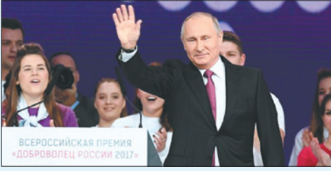
6 декабря. Москва. Путин на форуме «Доброволец»

На встрече с ветеранами и тружениками Горьковского автомобильного завода в Нижнем Новгороде президент России Владимир Путин объявил о своем намерении вновь баллотироваться на пост главы государства. «Лучшего места и лучшего повода для объявления об этом, наверное, и нет. Спасибо вам за поддержку, я буду выдвигать свою кандидатуру на должность президента Российской Федерации. Уверен, что все у нас с вами получится, благодарю вас», – сказал Владимир Путин. Напоминаем, что выборы состоятся 18 марта 2018 года.