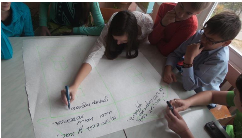
Фото 3 «Проектируем видео...»

Наличие инструментов и предварительные знания в создании медиа – это только первые шаги. Используемые инструменты позволяют извлечь выгоду из присущего молодежи оптимизма и чувства справедливости, помочь превратить незаинтересованную молодежь в творческих и четко выражающих свои мысли участников своих сообществ гимназии, города и района. Молодым людям есть что сказать, и при помощи программы «Adobe: голоса молодых» и навыков умелого модератора-педагога ребята обеспечиваются средствами и платформой, позволяющими говорить и быть услышанными.