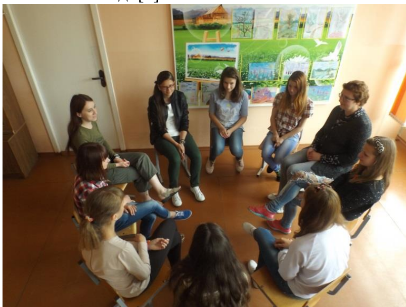
Фото 5 «Оценка «Продукта»

Медиаграмотность превращает пассивное восприятие медиасообщения в действие путем практики расшифровки, воспроизведения (рефлексии), постановки вопросов и, наконец, создания своих медиа. Она (медиаграмотность) также охватывает способность распознать пропаганду и предвзятость в новостях, понять влияние медиасобственности и медиаспонсорства на содержание посланий, выявлять стереотипы, искажения полов, рас и классов. Реклама и развлечение зачастую нацелены на молодых людей как на потребителей, и многие из них чувствуют, что основной поток медиа не отражает ту жизнь, которой они на самом деле живут. Их сверстники и сообщества часто изображены шаблонно в негативной манере, новости о них зачастую упоминаются лишь в криминальных сводках. Когда молодые люди не находят себя в медиасреде, то возникает необходимость обсудить чувство изоляции и поговорить о проблемах неравенства, предвзятости, классовых предрассудков и справедливости. Медиаграмотная молодежь сама определяет свое отношение к медиасодержанию, не позволяя этому содержанию навязывать ей чье-то место в обществе. Медиаграмотные молодые люди задают важные вопросы, которые помогают им лучше понять назначение своей медиаработы. Слушая или просматривая медиа, молодежь может спрашивать: Кто автор?, Откуда эти люди?, Каковы их положение и ценности?, Чего они хотят добиться этой работой?, Согласен ли я с их мнением? И т.д. [1]