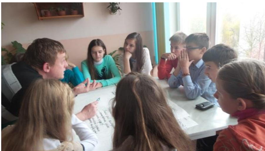
Фото 1 «Так рождалась идея...»