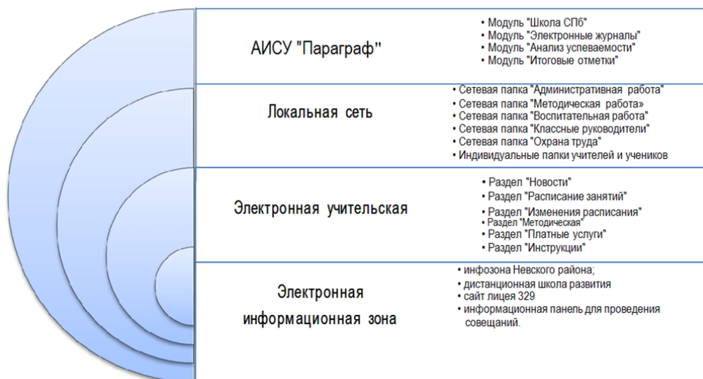
Схема системы электронного документооборота

В течение отчетного периода регулярно проводилось обновление и модернизация системы АИСУ «Параграф», сервисов «Электронный дневник», «СКУД. Система контроля и учета доступа», «СОП. Система оплаты питания». Данные сервисы объединены проектом «Единая Школьная Карта» и включает в себя безналичную систему оплаты питания в школьных столовых и контроль доступа через установленные турникеты в здание учебного учреждения. С помощью «Единой школьной карты» ученик проходит в школу и оплачивает покупки в школьной